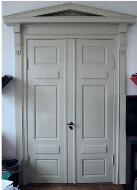
Tv. ovnnichen og th. den monumentale dør i byrådssalen.