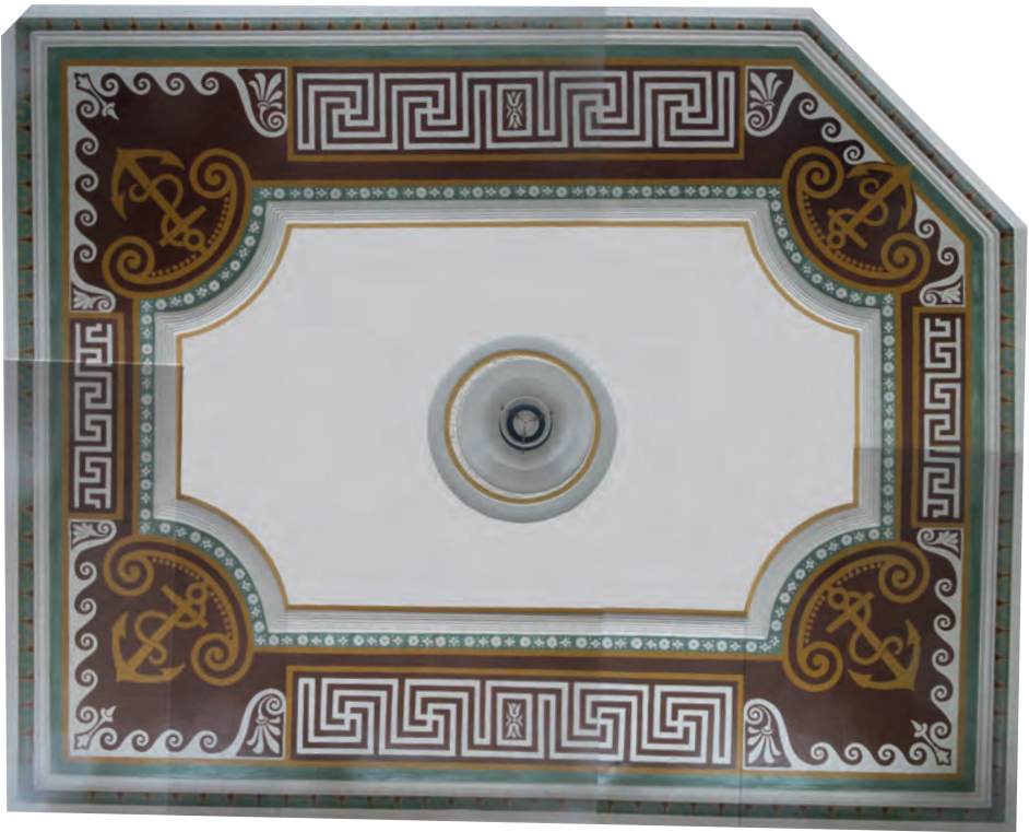
Loftet gengivet i en sammenklippet version. Mæanderborterne ses mellem Mariagerankerne.